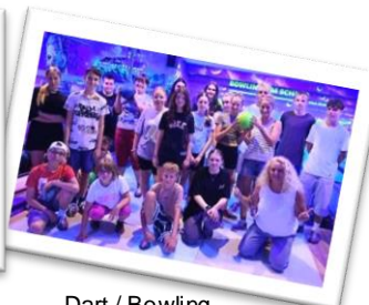
Dart / Bowling