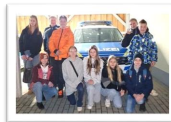
Polizei / Suchtprävention / Fahrschule / Kosmetik